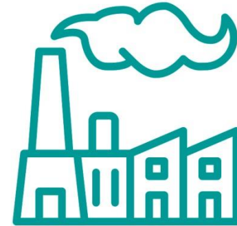
Výroba a výzkum